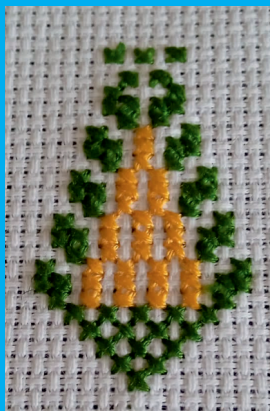
Sarwa / Árbol Ciprés