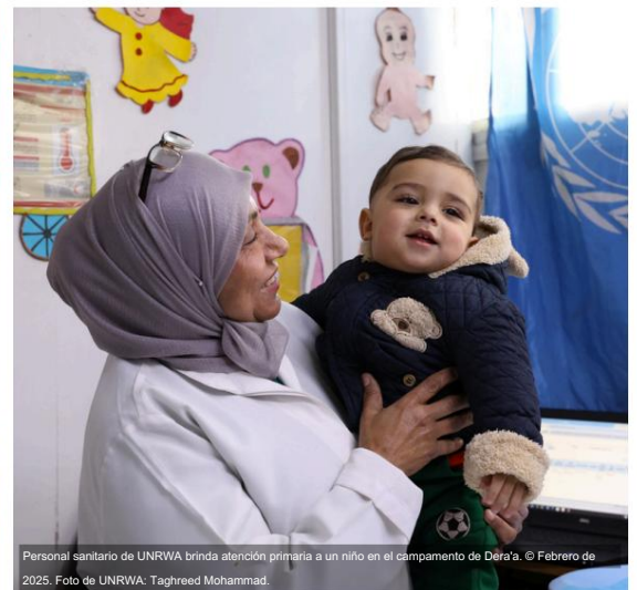
Personal sanitario de UNRWA brinda atención primaria a un niño en el campamento de Daira'a.