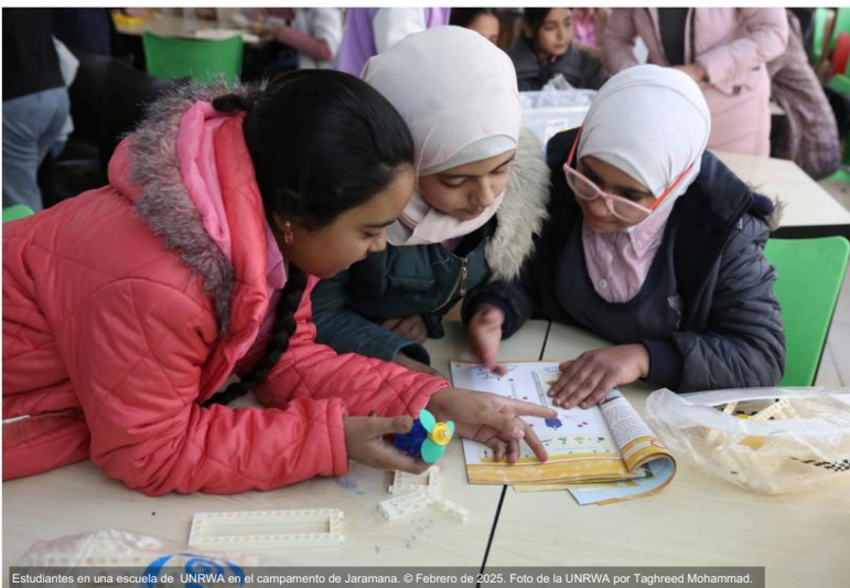
Estudiantes en una escuela de UNRWA en el campamento de Jaramana. © Febrero de 2025. Foto de la UNRWA por Taghreed Mohammad.

desembolsados desde el inicio del programa en 2003, por un valor aproximado de 70 millones de dólares.