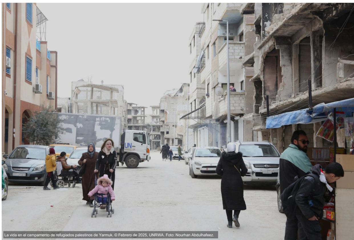
La vida en el campamento de refugiados palestinos de Yarmouk.