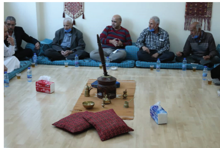
Apoyo psicosocial para mayores en el campamento Qabr Essit.

60 consejeros de apoyo psicosocial fueron formados para abordar la violencia contra menores.