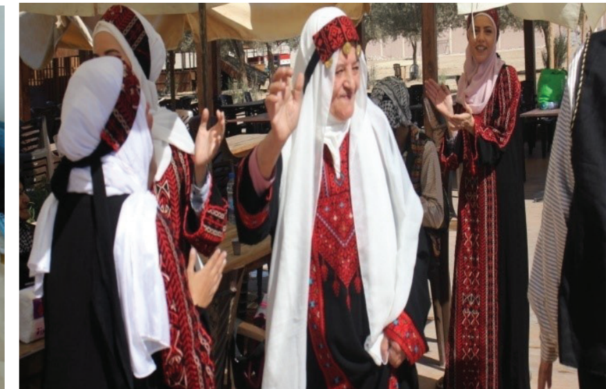
Apoyo psicosocial para mayores en Damasco.