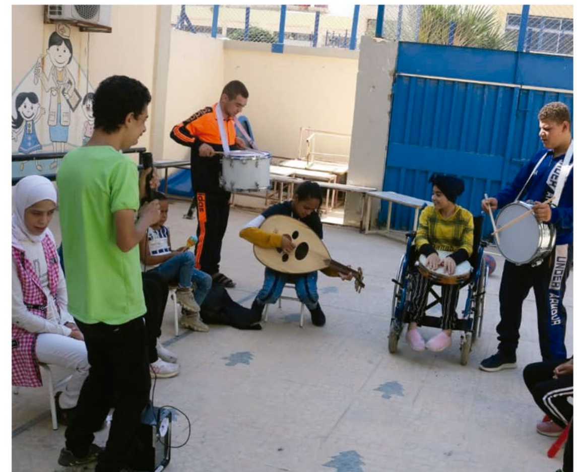
Actividades recreativas y deportivas durante la escuela de verano para personas con discapacidad en Sbeineh.

En junio se distribuyeron folletos de sensibilización sobre los REG (restos explosivos de guerra). El 31 de agosto se produjo un incidente muy grave de REG en el campamento de Ein el-Tal, en el que siete niños resultaron heridos y uno de ellos falleció más tarde. UNRWA planifica aumentar las sesiones de sensibilización sobre los REG.